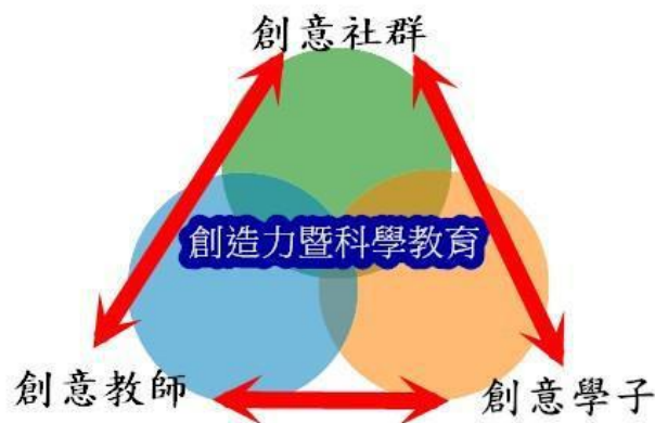
【科學技能創意競賽】發展計畫之架構圖

為有效精進教師創意教學與學子科學創意設計能力，循序漸進提升老師創意的涵養，以及培育更多的創意種子，無限地擴展創造力的魔力至校園的每一角落，本計劃發展的架構如下：