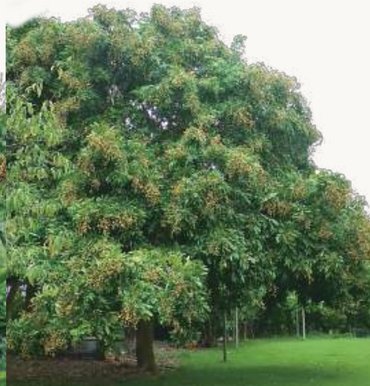
圖2. 在非農業區的低海拔山丘或平地老聚落、廟宇、公園等地極為常見無人管理之高聳散生植株。