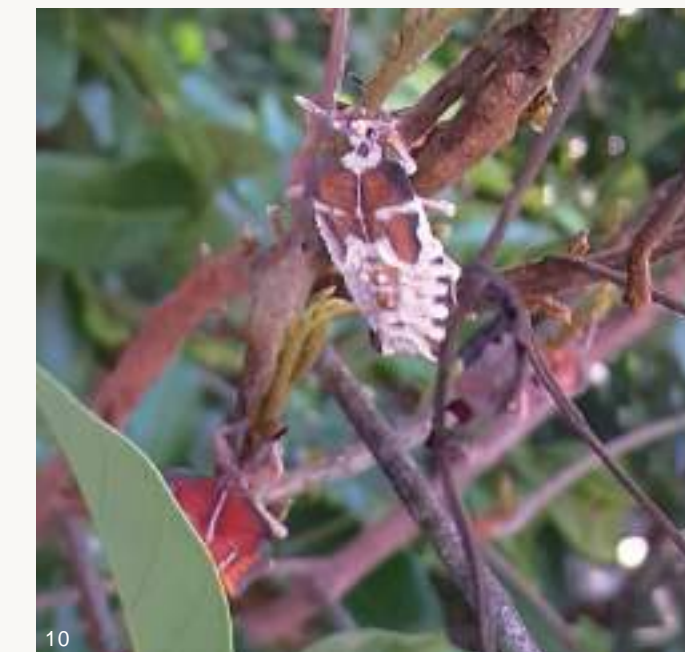
圖10. 108年梅雨季前後，大量荔枝椿象若蟲及成蟲感染蟲生真菌而死亡僵直掛在樹上，蟲體內白色黴菌從觸角、足、胸腹部等節間或氣孔、臭腺開孔長出。

寒流，荔枝及龍眼開花量豐，龍眼蜜產量足，但荔枝椿象族群密度也較高。相對的，108年首兩月平均日溫超過16°C為暖冬，無寒流，致使荔枝、龍眼開花結果少而歉收，龍眼蜜也幾乎無收，又加上108年梅雨季前後雨量充沛，若蟲及成蟲個體感染蟲生真菌死亡情形增加，使得該(108)年度荔枝椿象族群數量亦受到衝擊而大幅減少，與107年4~12月同期龍眼樹上荔枝椿象成蟲族群數量具明顯差異。