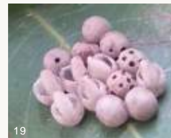
圖18~19. 龍眼葉背一批荔枝椿象卵，旁邊正有一隻平腹小蜂虎視眈眈地準備寄生（上圖）。14顆荔枝椿象卵（下圖），其中有6顆縱裂者為正常孵化成荔枝椿象一齡若蟲爬走，有4顆卵則每卵有1~7個圓孔，表示已經被跳小蜂寄生且羽化為小蜂成蟲飛離，另4顆則尚未孵化或羽化。