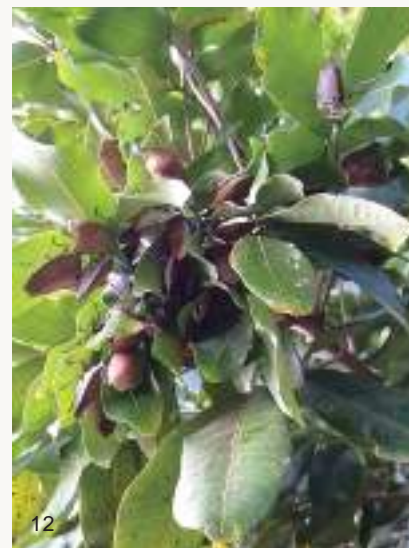
圖12~13. 荔枝椿象在龍眼葉下聚集越冬，此時進入生殖系統發育停止或緩慢的繁殖滯育期，此時不太活動，在樹下通常聞不到椿象臭味。

在臺灣，無患子與臺灣欒樹從10月開始漸漸枝葉稀疏，新羽化的荔枝椿象並不交配，漸漸飛離，銷聲匿跡。有部分可能分散飛至不明處所躲藏，然而它們曾被發現聚集在龍眼樹的葉背，且以成蟲方式度過日照漸短的秋冬。一般人在龍眼樹下也以為荔枝椿象都飛走了，因為此時已聞不到椿象臭味。