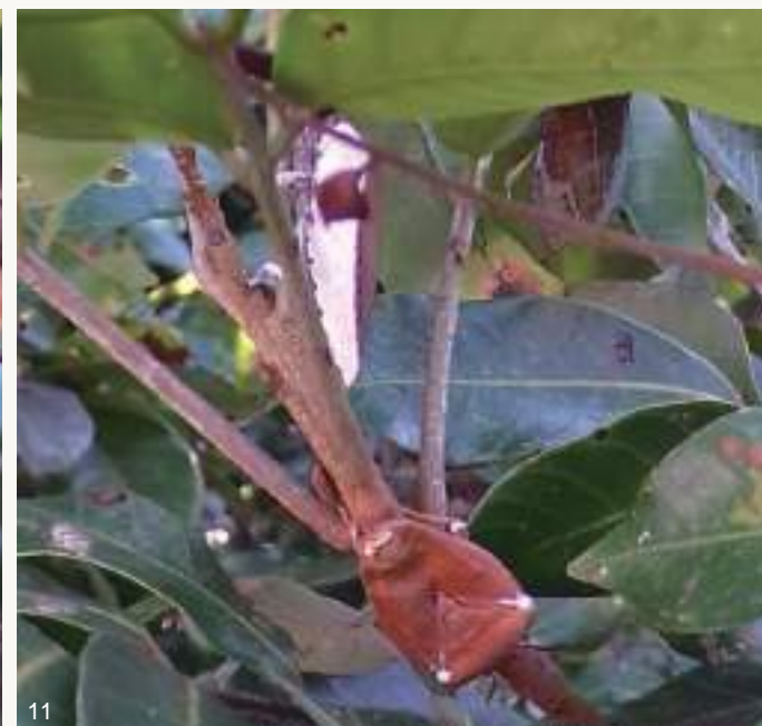
圖11. 108年梅雨季前後，大量荔枝椿象若蟲及成蟲感染蟲生真菌而死亡僵直掛在樹上，蟲體內白色黴菌從觸角、足、胸腹部等節間或氣孔、臭腺開孔長出。