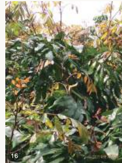
圖16~17. 龍眼葉芽如正常生長，應該會長出許多紅嫩枝葉（上圖）並正常展開逐漸變青綠。但如果發生鬼帚病（下圖），則葉芽無法展開，且組織增生毛呈現簇生狀乾枯情形，開花率亦會降低。

高雄大崗山一帶地區龍眼鬼帚病相當普遍，惟截至目前為止仍無法證實此病徵為荔枝椿象媒介不明病原造成；然而卻有愈來愈多證據顯示可能是因為節蟬數量暴增取食汁液，而使龍眼葉芽組織變形增生枯萎，導致樹葉無法展開且開花率降低。