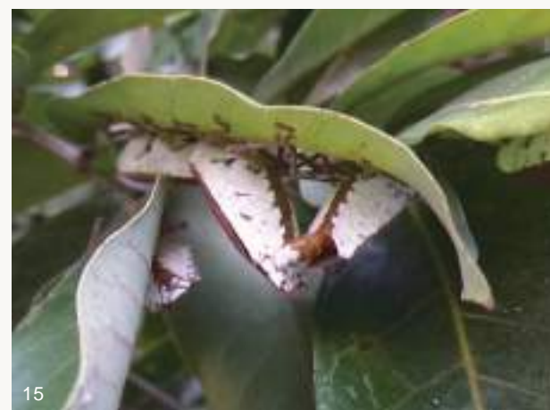
圖14~15. 一般來說，荔枝椿象通常喜歡在枝條或花葉芽上直立式交配，上方的雌蟲仍然邊交配邊吸樹汁（上圖）；剛打破越冬後在龍眼葉下水平式交配的情形則極為罕見（下圖）。