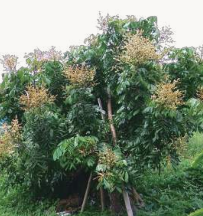
圖1. 龍眼為常綠喬木，在農業區為矮化集約式經營經濟作物。