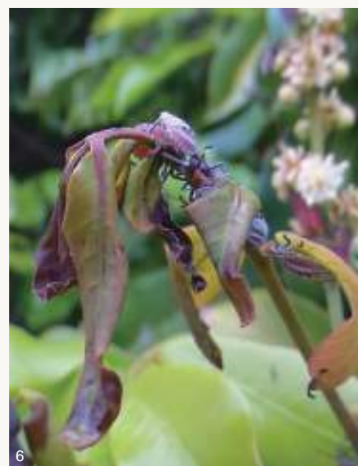
圖4~5. 龍眼大約在二月底至五月抽紅嫩枝葉並開花結幼果，常吸引荔枝椿象前來交配或吸汁，荔枝椿象粗短口針多直接插入花芽、葉芽、嫩枝、花柄或果柄，而非刺進花果或樹幹。