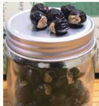
圖3. 龍眼果實似龍目，古詩云「圓如驪珠，赤若金丸，肉似玻璃，核如黑漆」。

荔枝椿象( Tessaratoma papillosa )屬半翅目(Hemiptera)、荔枝椿科(Tessaratomidae)，為荔枝及龍眼常見的害蟲，分布於泰國、越南、寮國、香港及中國等地，遲至1997年首次在金門發現，2009年則首次在臺灣高雄發現，目前除澎湖縣尚未發現、臺東縣、花蓮縣零星分布外，已經在臺灣各縣市普遍發生，其寄主植物主要為無患子科(Sapindaceae)植物包含荔枝( Litchi chinensis )、龍眼( Dimocarpus longan )、無患子( Sapindus mukorossi )及臺灣欒樹( Koelreuteria henryi )等四種喬木。