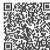
掃 QR code 報名