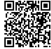
桃園市公立及非營利幼兒園 招生系統